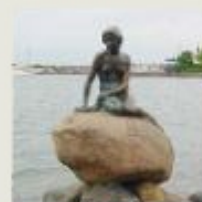
Den lille havfrue