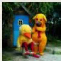
Bamse og Kylling